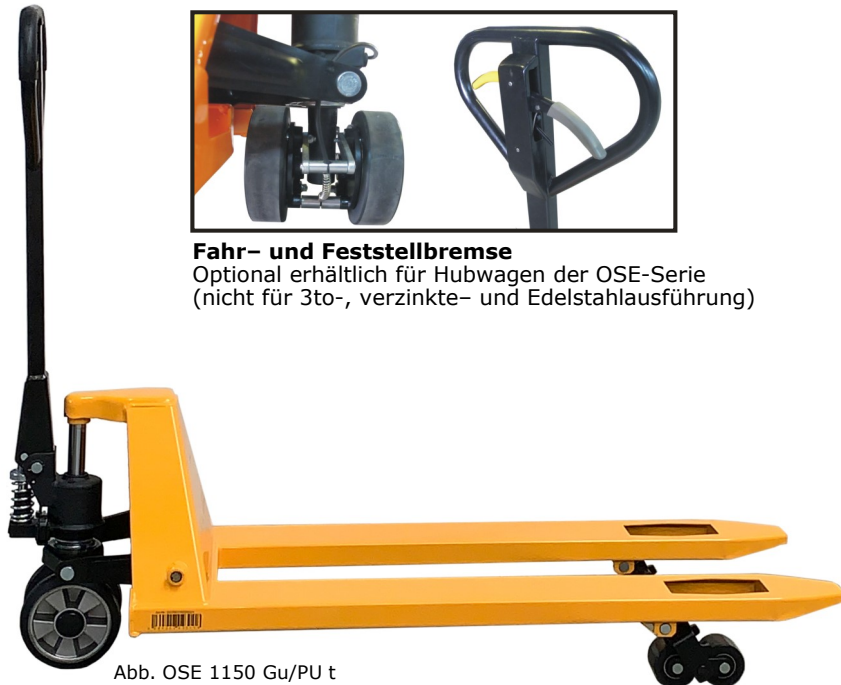
Abb. OSE 1150 Gu/PU t

Optional erhältlich für Hubwagen der OSE-Serie (nicht für 3to-, verzinkte- und Edelstahlausführung)