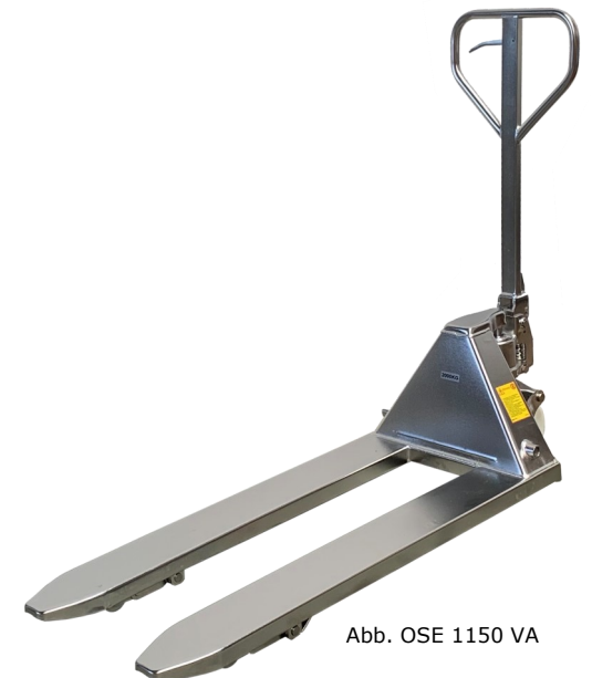
Abb. OSE 1150 VA

Farbabweichungen drucktechnisch bedingt möglich · Technische Änderungen und Irrtümer vorbehalten