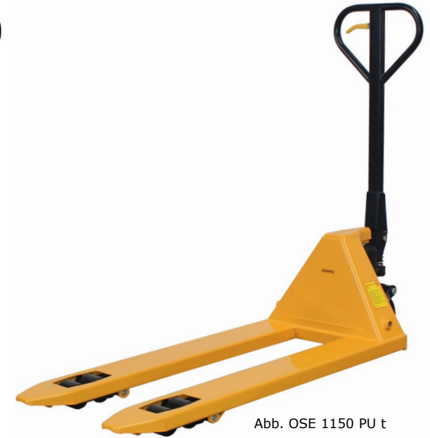
Abb. OSE 1150 PU t