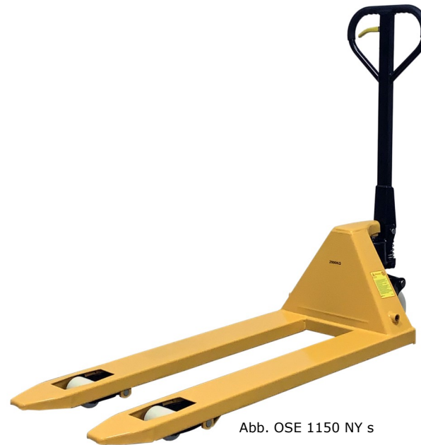
Abb. OSE 1150 NY s